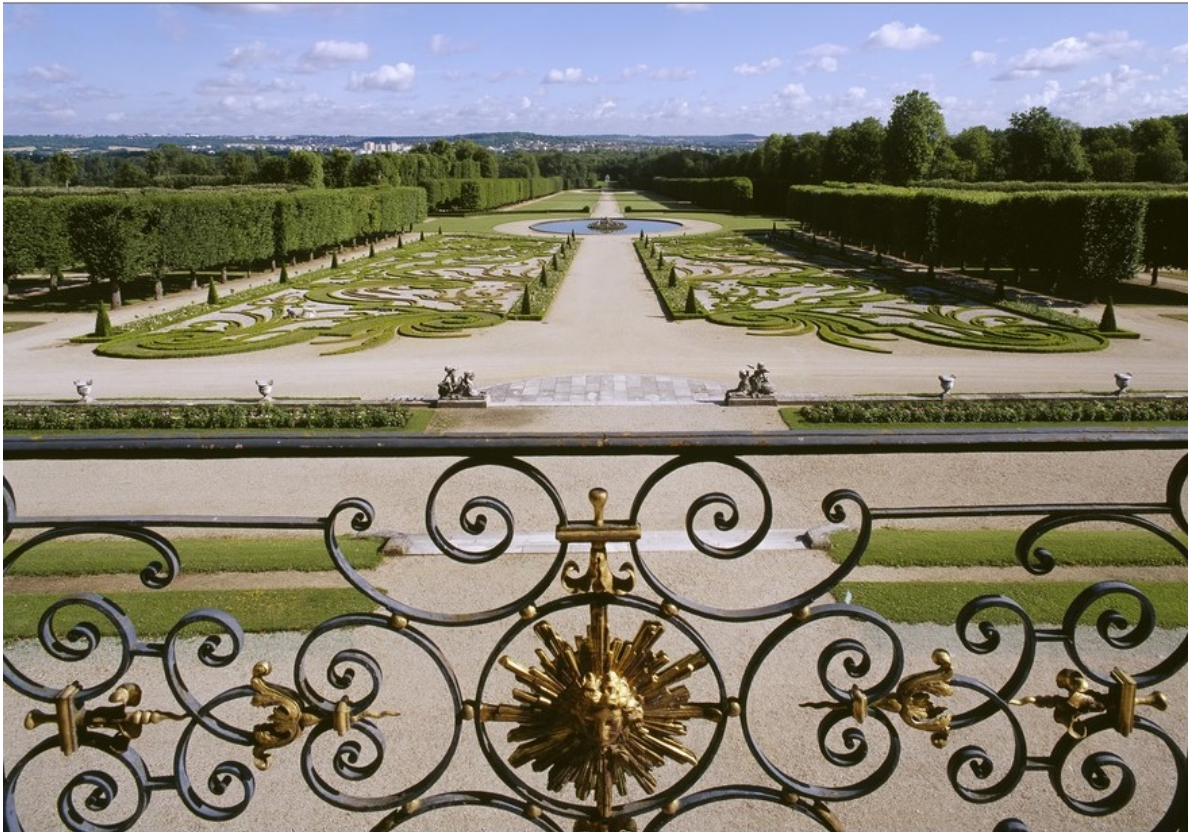
3 – Henri Duchêne Parc du château de Champs-sur-Marne

Les journées Henri et Achille Duchêne 7, 8 & 9 novembre 2019