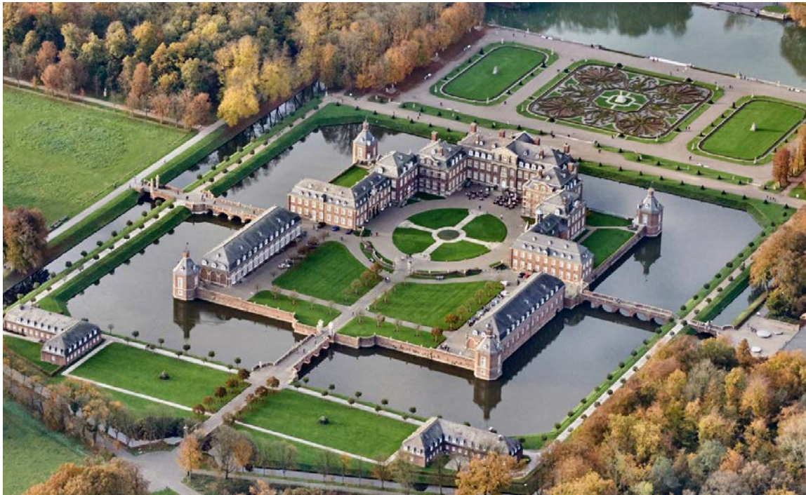
6 – Achille Duchêne, Parc du château de Nordkirchen (Rhénanie-du-Nord-Westphalie)

Les journées Henri et Achille Duchêne 7, 8 & 9 novembre 2019