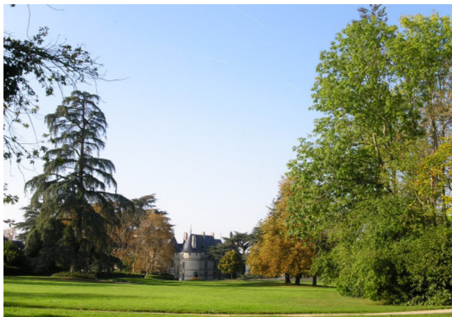
1 - Henri Duchêne, Parc de Chaumont-sur-Loire

Les journées Henri et Achille Duchêne 7, 8 & 9 novembre 2019