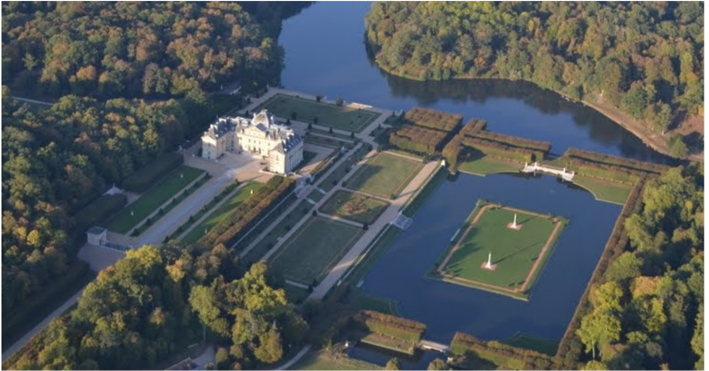
4 – Henri et Achille Duchêne Parc du château de Voisins, Saint-Hilarion (Yvelines)